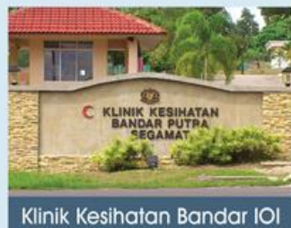
Klinik Kesihatan Bandar IOI